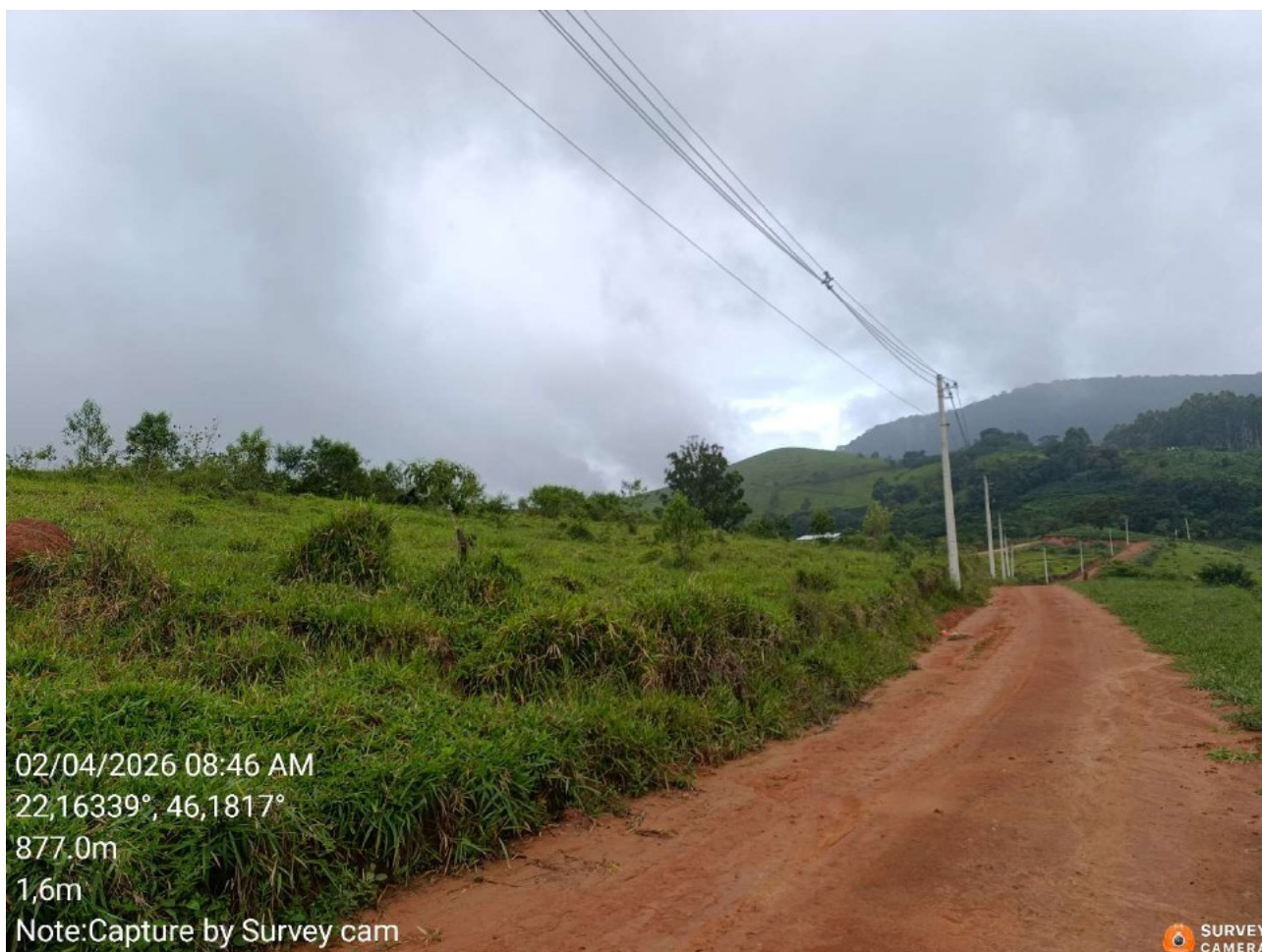
Imagem 02 – Rede de Energia Elétrica

Senador Jose Bento/MG, 19 de fevereiro de 2026.